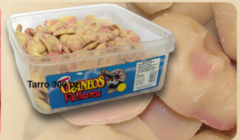
Craneos 300 pz. x 3.4 gr. REF.21003