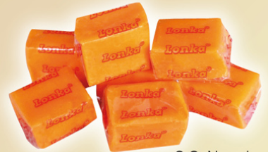
S.C. Naranja REF.75014