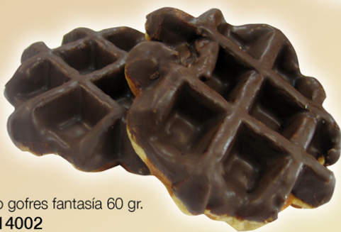
Choco gofres fantasía 60 gr. REF.14002