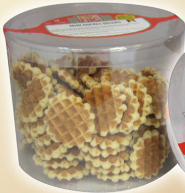
Mini gofres belgas REF.14501