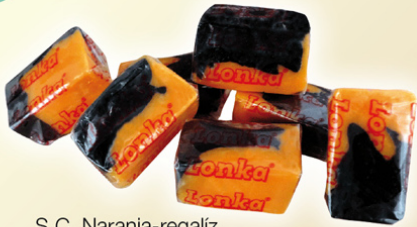
S.C. Naranja-regaliz REF.75017