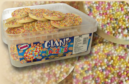
Jazzies gigantes chocolate 60 x 17 gr. REF.21005