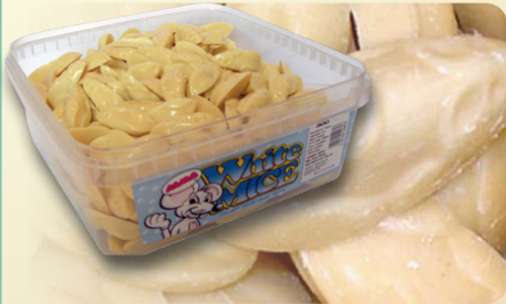
Ratones blancos 300 pz. x 3.4 gr. REF.21001