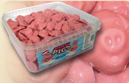
Cerditos 300 pz. x 3.4 gr. REF.21002