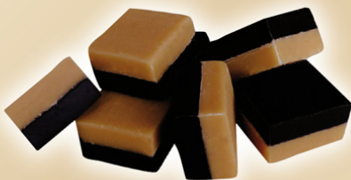
Fudge Caramelo-regaliz REF.75220