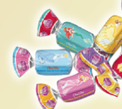
Jellies Princesas REF.10015