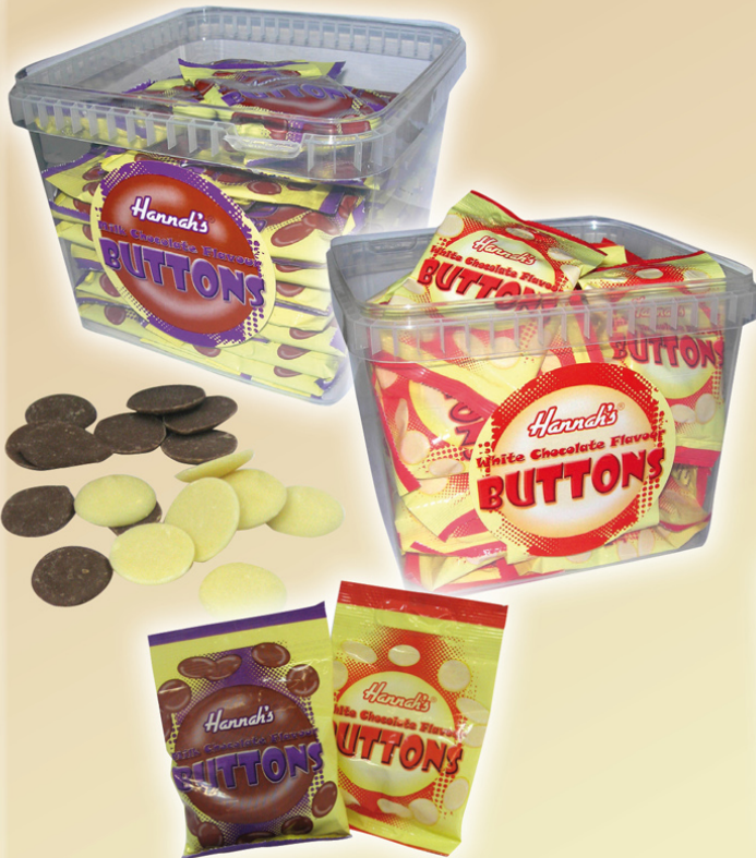
Buttons chocolate blanco 40 x 24 gr. REF.21007