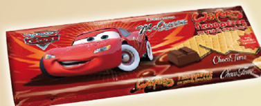
Galletas de chocolate Cars 125 gr. REF.10019