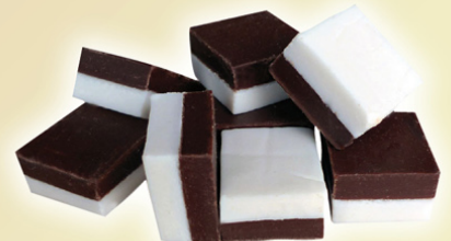
Fudge Chocolate-menta REF.75219