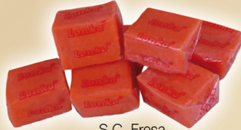
S.C. Fresa REF.75015