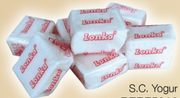
S.C. Yogur REF.75016