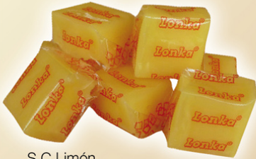
S.C. Limón REF.75013