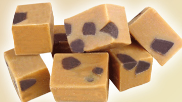
Fudge Chocolate-chips REF.75102