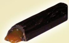
Troncos rellenos caramelo 60 x 16 gr. REF.21006