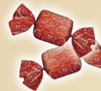
Jellies Cars REF.10016