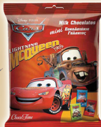
Mini-napolitana Cars REF.10018