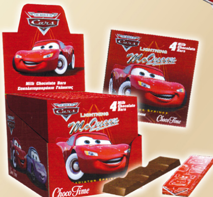
Barritas de chocolate Cars 12 und. x 40 gr. REF.10012